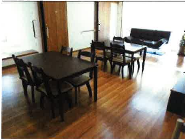
リビングルーム・食堂